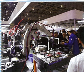
▲▼最新鋭の溶接機器、 ロボットの实演が期待される