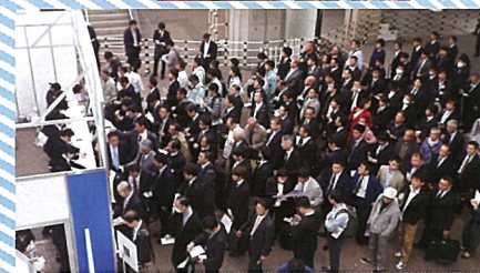
▲多くの来場者が見込まれる