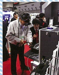
◀バーチャル溶接を体験