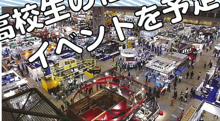
▲会場には最新溶接技術・製品が一堂に